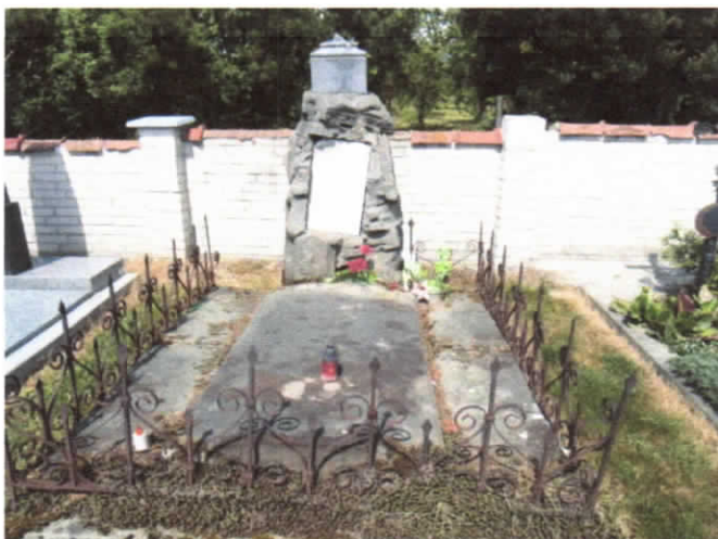
Hrobové místo č. 90/91 – dvojhrob