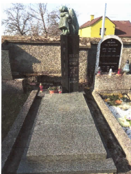
Hrobové místo č. 195 – jednohrob (nájem skončil v roce 2008)