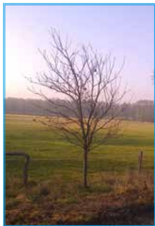
Foto: Švestka vysázená na jaře 2013 na Varhošťské.