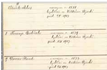
Tři pánové, kteří s dalšími založili spolek Svornost

K 31. 12. 2021 bylo registrováno 62 členů. Spolek se aktivně zúčastňuje sběru železa. Finanční prostředky využívá na dary při životním jubileu členů, zájezdy, odpolední posezení, vyplácení pohřebného a dary jiným spolkům při kulturních akcích. Spolek Svornost s tímto programem je jedním spolkem v republice.