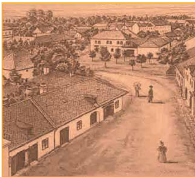
Náměstí ve Velkém Újezdě.