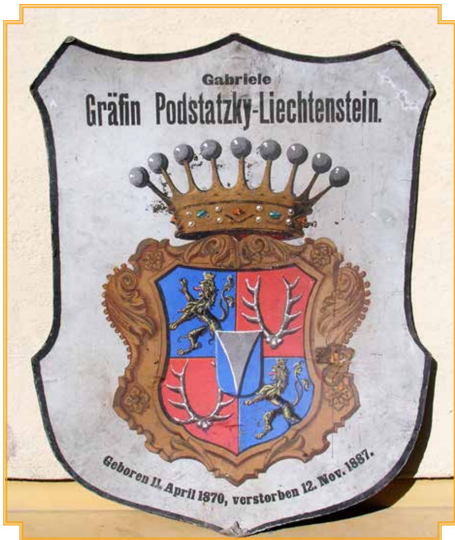
Pohřební štít Gabriely hraběnky Podstatské-Lichtenstein.