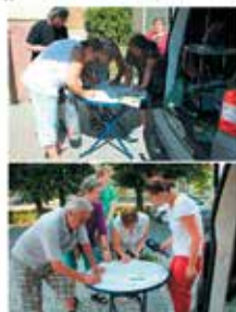
Il. Český rozhlas

z ankétních listků se každý soutěžní den po projetí celé anoncované trasy vybere jeden výherce hlavní ceny. Výhercem se stane ten, kdo nejlépe odpoví na tipovací otázku. výherce bude vyhlášen ve vysílání ČRo Olomouc a RH ČRo OL mu doveze denní výhru na uvedenou adresu. výjezd RH ČRo OL bude probíhat v odpoledních hodinách (12:00 – 18:00 hodin).