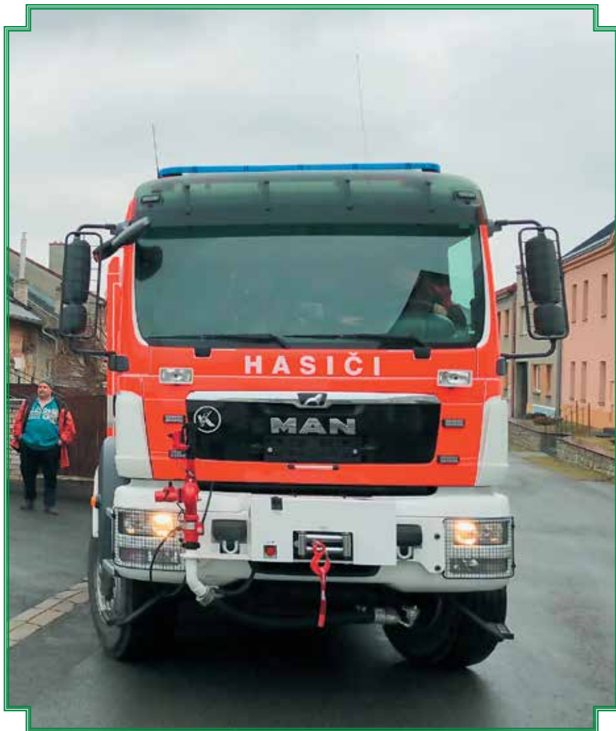
Nový hasičský vůz CAS 20/4000/240 S2R, Snímek Ondřeje Zatloukala.