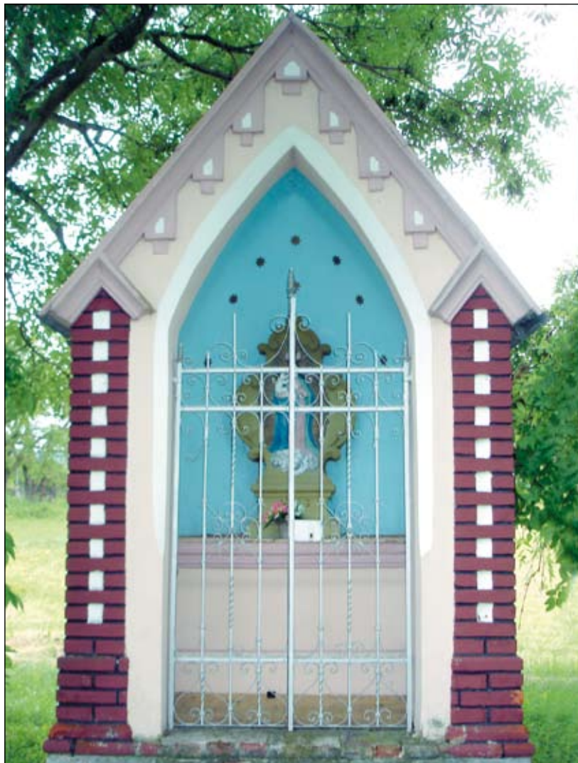
Kaple Panny Marie u Hronova