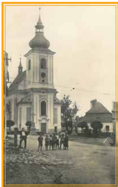
Historický pohled na kostel a faru ve Velkém Újezdě.