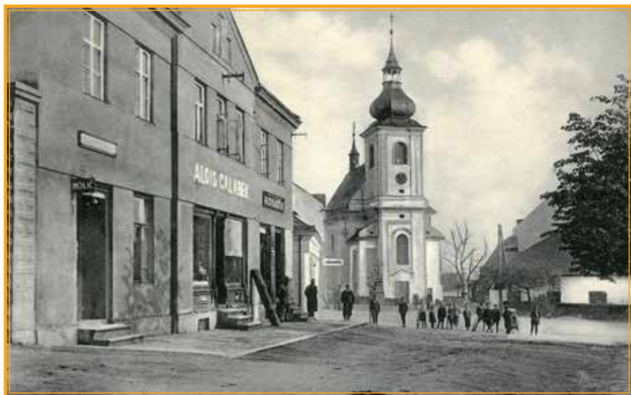
Původní podoba náměstí ve Velkém Újezdě.

Pozn.: Redakce prosí všechny spoluobčany, kteří mají doma vzácné a zajímavé snímky našeho městyse, o kontakt s tím, že je rádi uveřejníme v jednom z dalších čísel Žibřida.