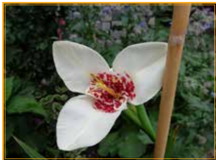
Tygřice paví (Tigridia pavonia)