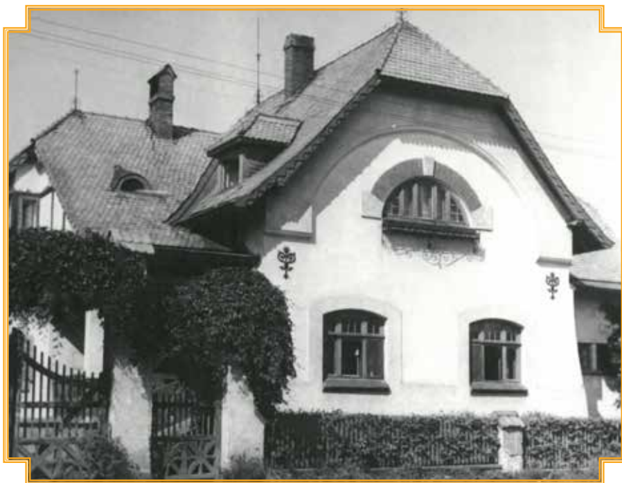
Historická podoba Wawerkovy vily ve Velkém Újezdě.