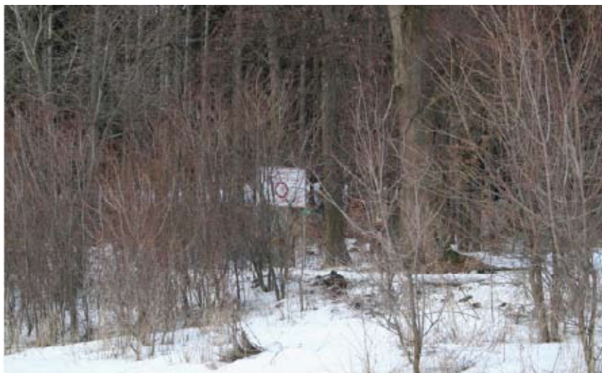
Sv. Isidor před úpravou