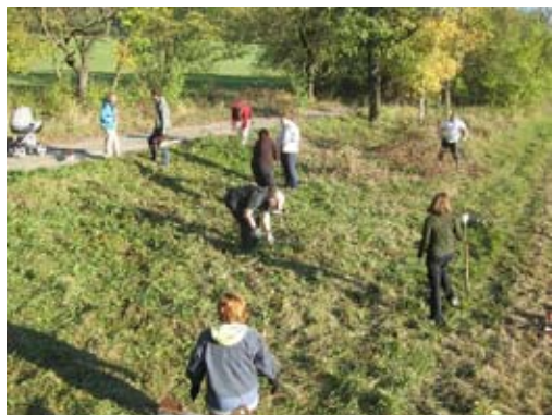
Sv. Isidor během udržovacího zásahu.