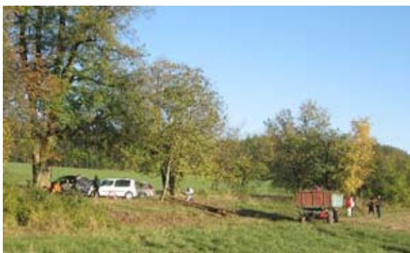
Sv. Isidor po úpravě a následném udržovacím zásahu.