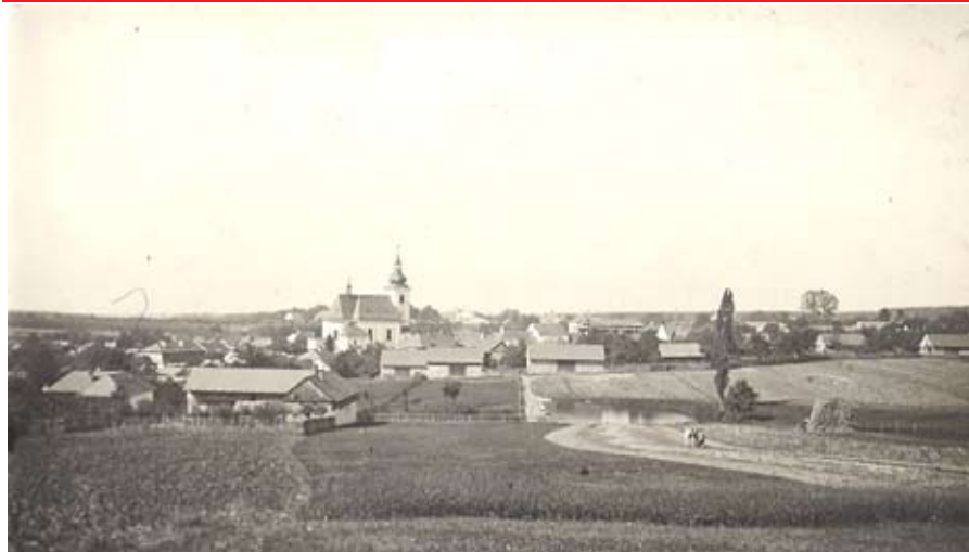
Pohled na Velký Újezd z lokality Vinohrady, (1905).