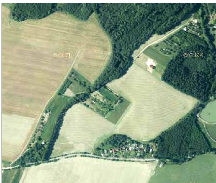
Lokality Rychvald, Kostelíky, Zadní Klče, Na Sušárně a Pastviska v proměnách staletí.