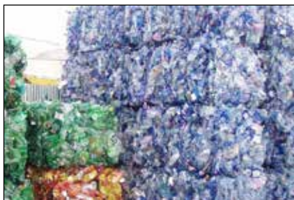
obr. 1 – pytlový sběr ve Velkém Újezdě, obr. 2 – třídící linka Šterberk