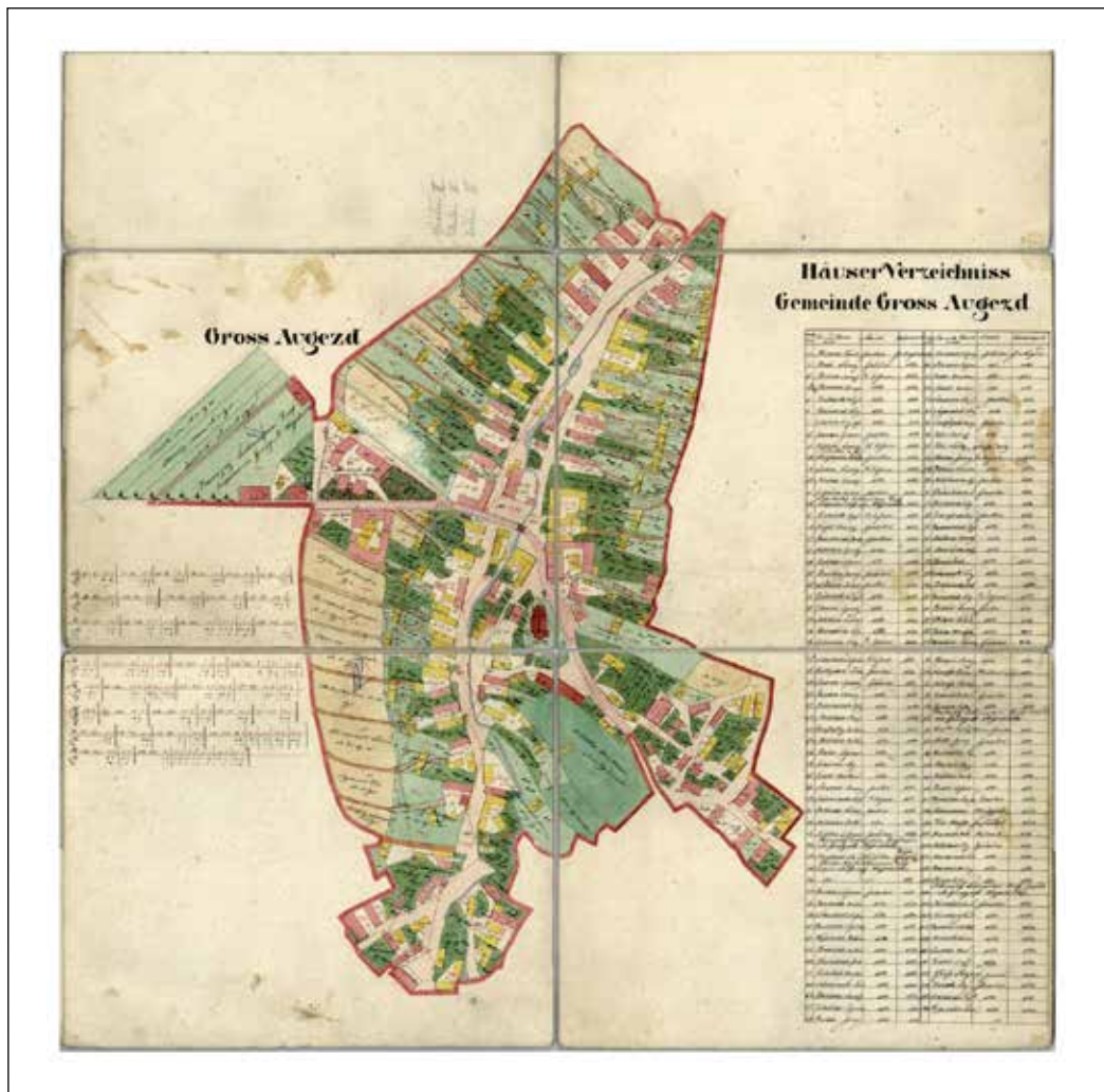
Městys Velký Újezd v roce 1830. Zemský archiv Opava, pobočka Olomouc.

Pozn.: Redakce prosí všechny spoluobčany, kteří mají doma vzácné a zajímavé snímky našeho městyse o kontakt s tím, že je rádi uveřejníme v jednom z dalších čísel Žibřida.